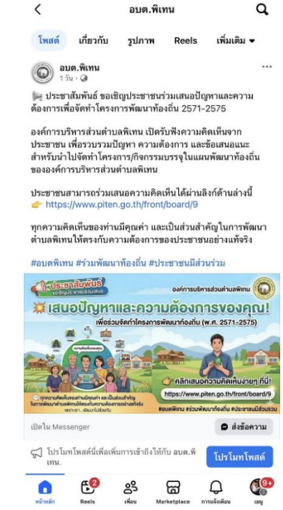
ประชาสัมพันธ์ทางเพจอบต.พิเทน