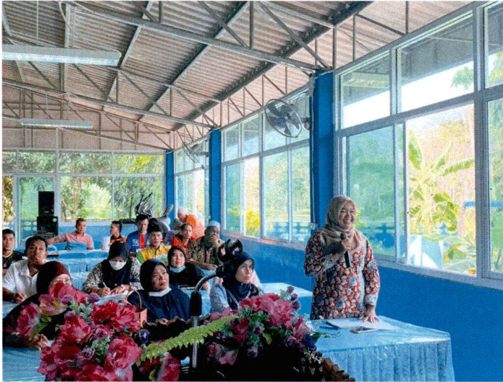
ใบลงทะเบียนเข้าร่วมโครงการประชุมประชาคมระดับตำบล สำหรับประชาชนตำบลพิเทน วันที่ ๗ มีนาคม ๒๕๖๖ เวลา ๐๘.๓๐ - ๑๔.๐๐ น. ณ องค์การบริหารส่วนตำบลพิเทน

จำนวนผู้เข้าร่วมโครงการประชุมประชาคมระดับตำบล ๑๐๙ คน